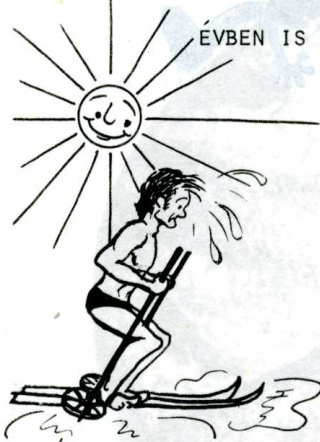
a télisport kedvelői...