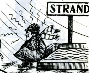
a strandolók ...